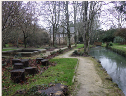
Jardin de l'Argentor