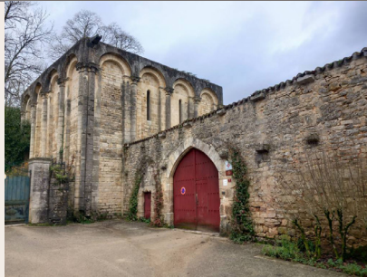
Abbaye de Nanteuil-en-Vallée

Outre son patrimoine bâti, Nanteuil-en-Vallée offre un patrimoine paysager de qualité dans les jardins de l'Argentor conçus par l'architecte Eugène Bureau dans les années 1920 et un jardin aquatique séparés par le canal des moines.